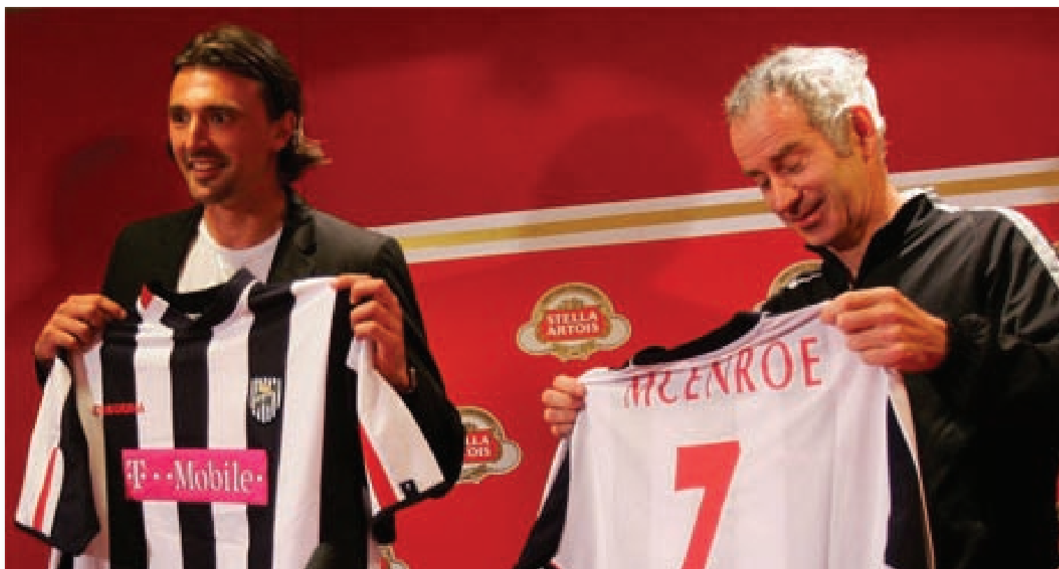
Goran Ivanisevic e John McEnroe receberam um presente do clube de futebol inglês West Bromwich Albion com os seus nomes nas costas e o croata tornou-se num autêntico 'baggie'.