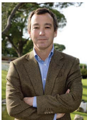
Vale do Lobo

Novo presidente Estrutura accionista renovada